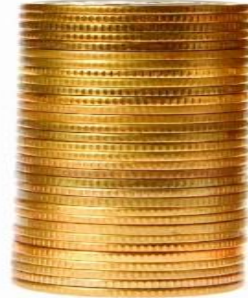
النقدين (الذهب والفضة)